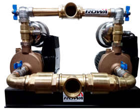
MAX PRESS 25 E