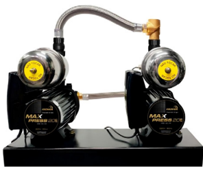
MAX PRESS 20 E