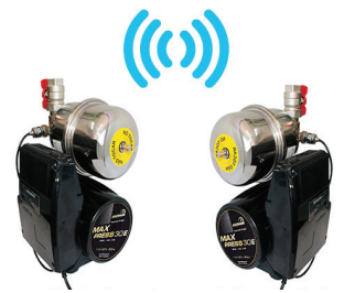
MAX PRESS 30 E