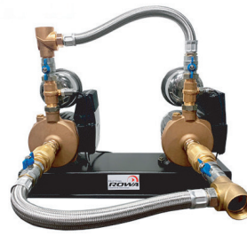
MAX PRESS 26 E