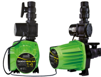
TANGO SOLAR 14