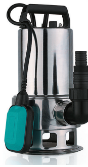
RW DRAIN 750